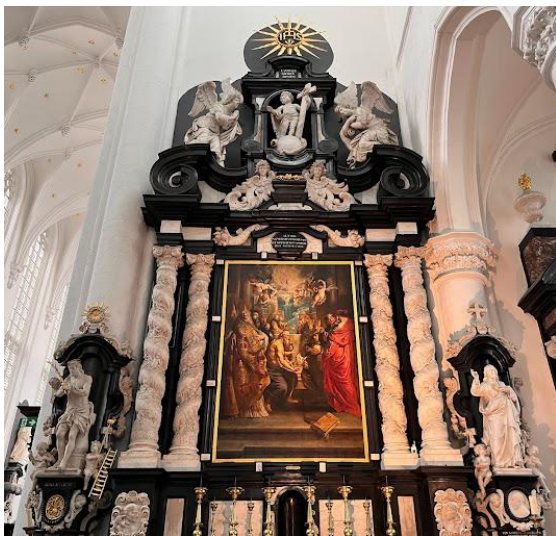
Sint Paulus - kerk