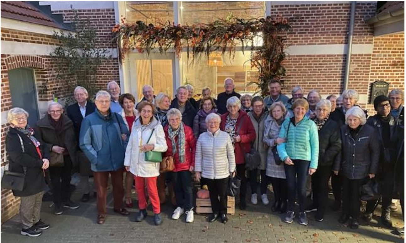
'Klassenfoto', gemaakt door gastvrouw Els Schrijvers van De Lokalen in Meer