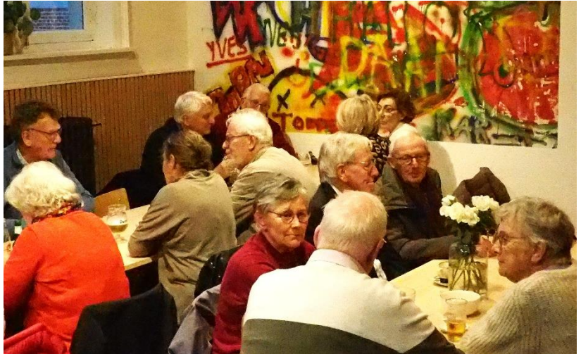
'De Lokalen' in Meer