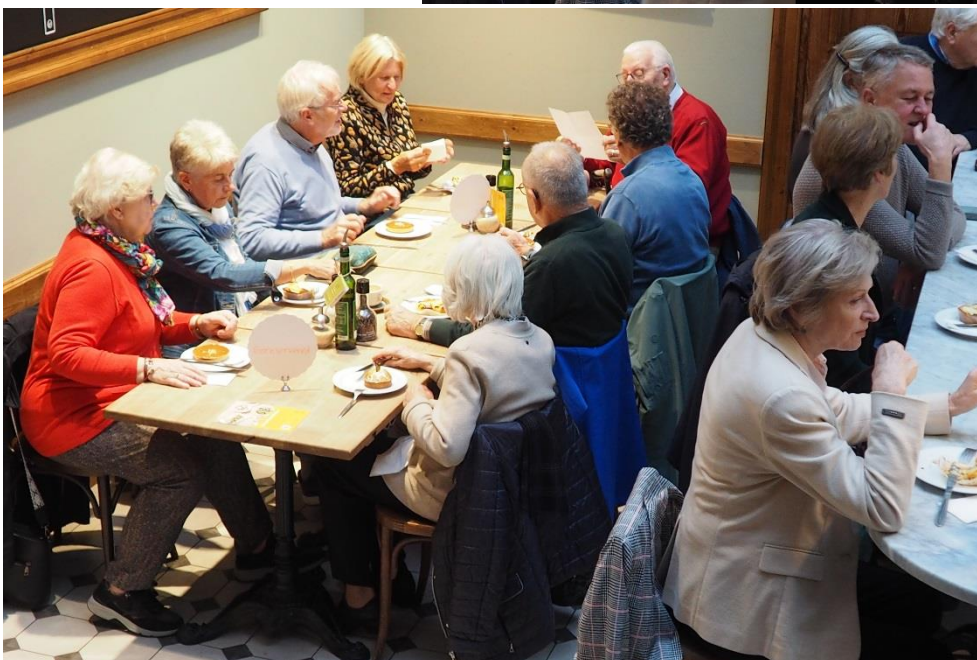
Le Pain Quotidien