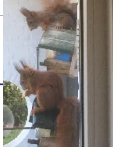
BRUTALE BUURJONGENS AAN DE VOGELPINDAKAAS