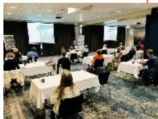
Zaal Willem II-stadion, Tilburg

In de cursus Meesters van het wantrouwen geeft Ype de Boer u inzicht in het gedachtegoed van vier bijzonder invloedrijke denkers: Kant, Marx, Nietzsche, Freud en u leert vanuit verschillende perspectieven het mens-zijn en de eigen tijd te bezien.